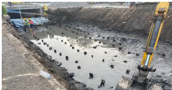
Gambar 2. Redesain Fondasi Cerucuk Bambu