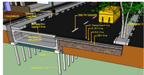
Gambar 1. Rencana Awal Fondasi Mini Pile

Penelitian kali ini selain menganalisis perkuatan struktural, juga melakukan komparasi yang ditinjau dari aspek biaya dan waktu antara desain fondasi cerucuk bambu dengan mini pile . Berikut gambaran desain fondasi mini pile maupun cerucuk bambu terlampir pada Gambar 1 . dan Gambar 2 . di bawah ini :