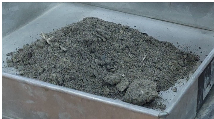
Gambar 1. Bottom ash residu pembakaran sampah domestik

Pengujian karakteristik agregat halus dilakukan untuk memastikan kelayakan material sebelum digunakan dalam campuran paving block . Uji kandungan bahan organik untuk pasir berdasarkan SNI 2816:2014 menunjukkan warna larutan pada tingkat 2, yang menandakan kandungan organik pada agregat halus masih dalam batas aman. Pengujian serupa juga dilakukan pada bottom ash , di mana secara visual larutan menunjukkan tingkat kekeruhan rendah (tingkat 1), sehingga dapat dikategorikan memiliki kandungan bahan organik yang rendah dan layak digunakan sebagai material substitusi. Selanjutnya, uji berat jenis dan penyerapan air mengacu pada SNI 1970:2008 menghasilkan nilai berat jenis bulk pasir sebesar 2,53, berat jenis SSD 2,58, dan berat jenis semu 2,66, dengan penyerapan air sebesar 2,04%, yang menunjukkan karakteristik agregat memenuhi standar. Selain itu, hasil uji kadar lumpur sebesar 2,33% juga masih berada dalam batas yang diizinkan. Secara keseluruhan, agregat halus dan bottom ash yang digunakan dinyatakan layak untuk digunakan dalam campuran paving block .