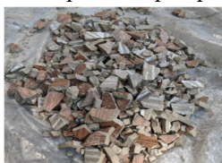
Gambar 2. Pecahan limbah batu granit (Fiery & Munthe, 2025)

Granit merupakan batuan beku yang terbentuk dari proses kristalisasi magma di dalam perut bumi. Granit banyak dimanfaatkan sebagai bahan baku pembuatan keramik, batu hias, lantai, serta ornamen dinding. Granit memiliki sifat fisik yang kuat, keras, dan tahan terhadap beban, erosi, serta abrasi, sehingga menjadikannya material yang awet dan tahan terhadap pelapukan (Aswanti dkk., 2024). Pecahan limbah batu granit yang digunakan dalam campuran beton seperti tampak pada Gambar 2.