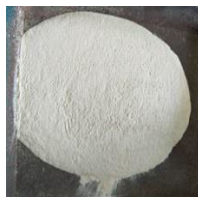
Gambar 1. Serbuk cangkang telur (Rumbyarso & Ulum, 2021)

sebagian semen. Ketersediaannya melimpah seiring dengan tingginya konsumsi telur menjadikan limbah cangkang telur belum dimanfaatkan secara optimal (Devi dkk., 2024). Serbuk cangkang telur yang digunakan pada campuran beton seperti tampak pada Gambar 1.