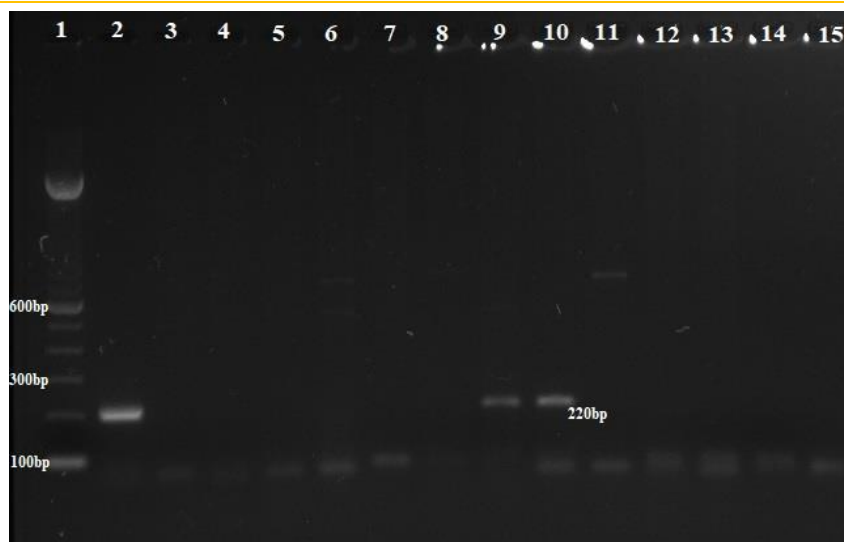
Gambar 1. Hasil elektroforesis amplifikasi gen MA dengan panjang 220 bp terhadap sampel paru DOC, ayam broiler kelompok kontrol tanpa suplementasi (K1 s/d K5) dan dengan suplementasi water additive kimchi 0,2% (P1 s/d P5). Keterangan: 1. Marker (M), 2. Kontrol positif (K+), 3. Sampel paru DOC (negatif), 4 s/d 8. Kelompok kontrol minggu pertama sampai kelima (negatif), 9 s/d 10. Kelompok perlakuan minggu pertama sampai kedua (positif), 11 s/d 13. Kelompok perlakuan minggu ketiga sampai kelima (negatif). 14. Kontrol negatif (K-) dan 15. No template control (NTC).

Infeksi AI yang terjadi pada P1 dan P2 merupakan infeksi subklinis, karena tidak tampak adanya gejala klinis AI. Infeksi subklinis AI pernah dilaporkan di China pada ayam layer. Ayam tidak menunjukkan gejala klinis, namun terdeteksi HPAI A/chicken/Qingdao/1/2014(H5N2). Kejadian infeksi subklinis tersebut disebabkan oleh vaksinasi masal yang dilakukan di negara tersebut (Ma et al. , 2014). Infeksi subklinis HPAI H5N1 pada DOC telah terbukti terjadi (Setyawati, 2010). Keberadaan infeksi subklinis di Indonesia disebabkan oleh kondisi endemik, kegagalan vaksinasi dan kemampuan mutasi virus (Wibawa, 2012).