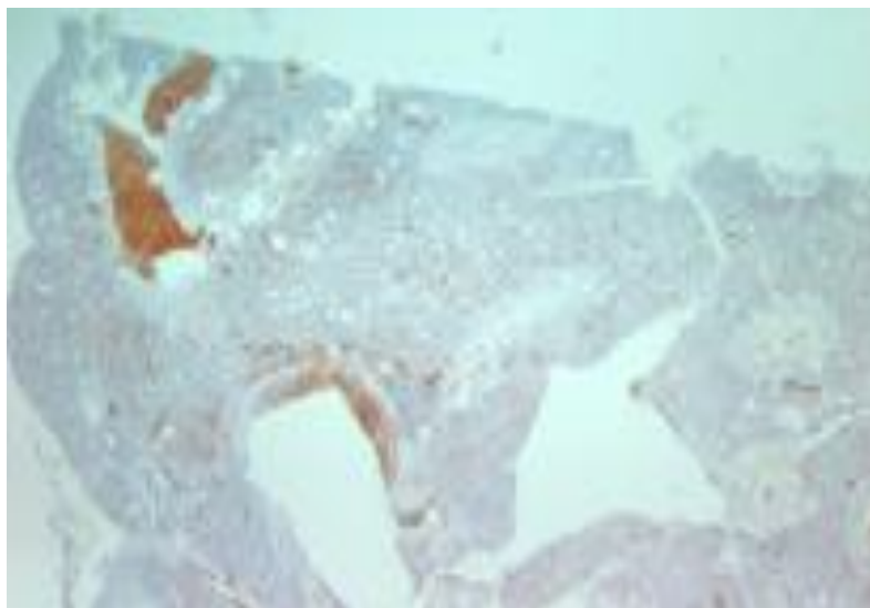
Gambar 2. Gambaran hasil imunopatologis imunohistokimia paru-paru berasal dari ayam potong yang tidak diberi suplementasi water additive Kimchi 0,2 % (K) yang dinekropsi pada minggu ketiga. Paru-paru terinfeksi positif virus avian influenza (VAI). Partikel VAI (virion) terlihat sebagai deposit presipitasi kecoklatan (Streptavidin biotin, 250x.).